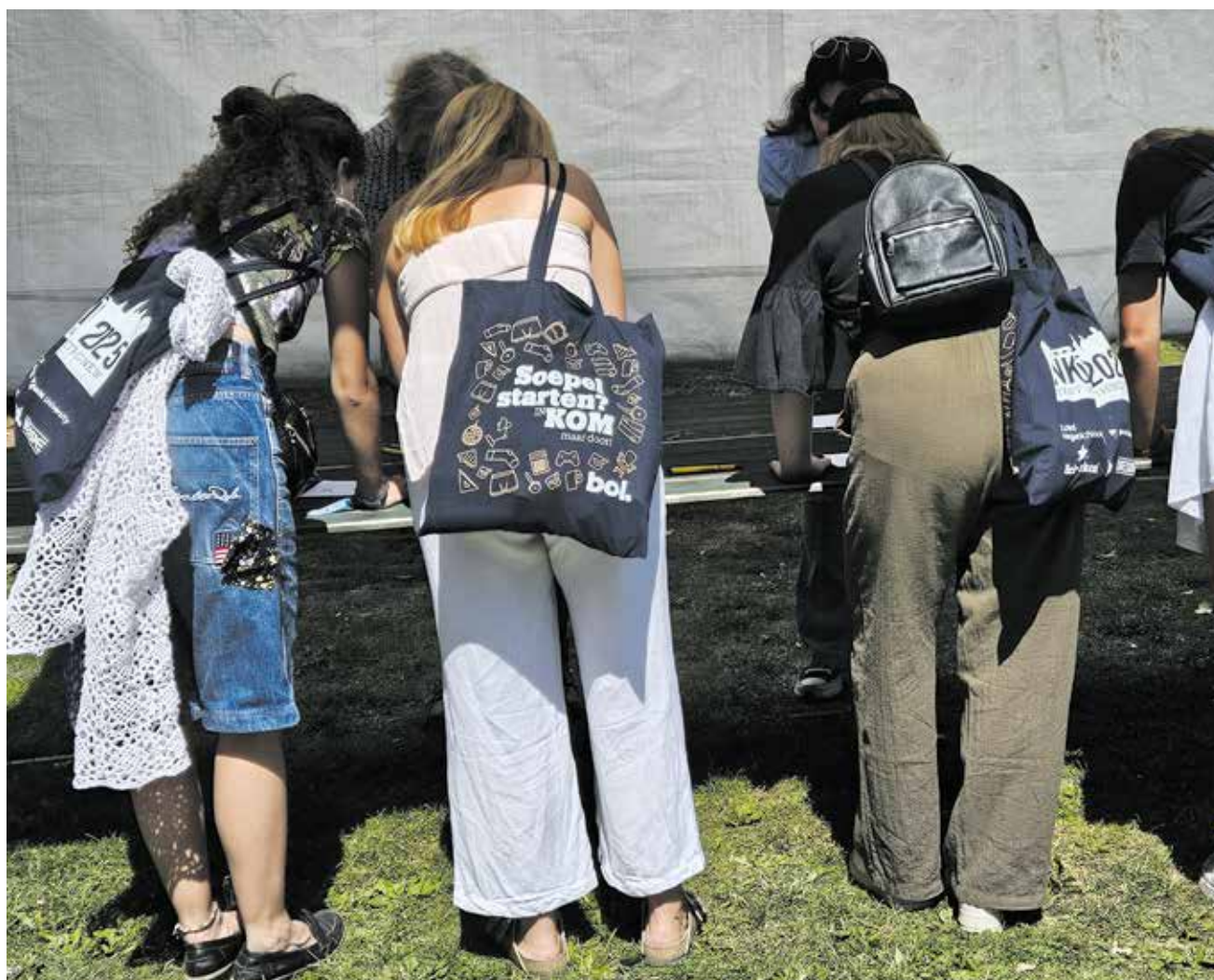
Eerstejaars tijdens de INKOM 2025

De INKOM krijgt een nieuw jasje. De universiteit wil de kennismakingsweek voor eerstejaars vanaf 2027 combineren met de facultaire introducties die traditiegetrouw in de laatste week van augustus staan gepland. Mogelijk verdwijnen de grote feesten in het MECC.