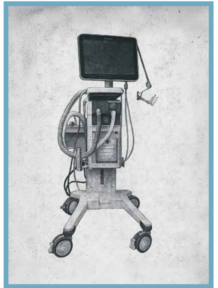
ServI-beademingsapparaat. Gebaseerd op een foto van Wikimedia/BreathDiver, bewerkt met Adobe software

Tekst: Cleo Freriks Illustraties: The Matter of Hospitals , essays 'Introduction' en 'Ventilators'